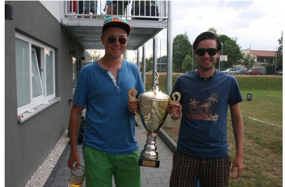
Der SV Kinsau holte beim diesjährigen Lechcup den Pokal.